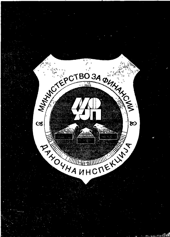
Задна внатрешна страна на повезот