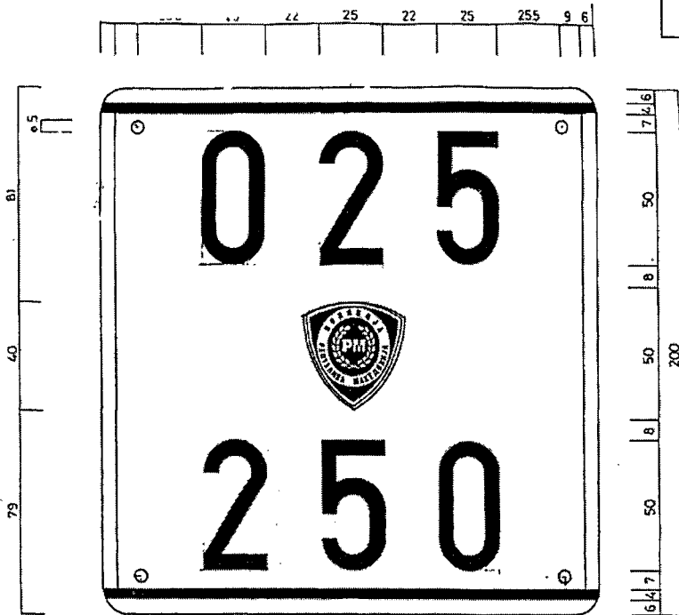
РЕГИСТАРСКА ТАБЛИЧКА ЗА МОТОРЦИКЛИ СО РАБОТНА ЗАФАТНОСТ НА МОТОРОТ ПРЕКУ 50 ccm